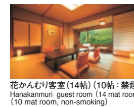
花かんむり客室(14帖)(10帖:禁煙) Hanakanmuri guest room (14 mat room) (10 mat room, non-smoking)