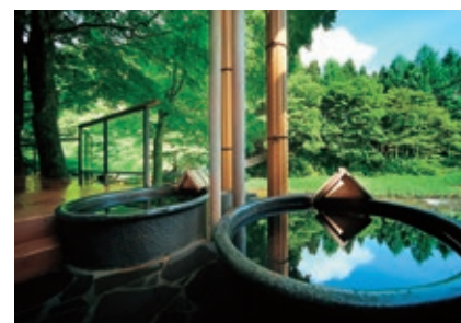
川の湯 信楽焼陶器風呂 Kawa no Yu - Shigarakiyaki (a special type of pottery) bath