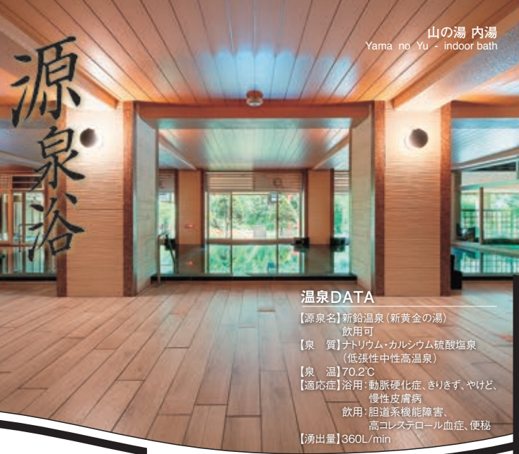
山の湯 内湯 Yama no Yu - indoor bath