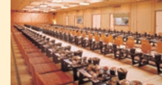
1F 大宴会場「いわて」(宴会場280名様) (イステールでのご宴会は220名様まで可) 1st Floor "Iwate" Banquet Hall (Tatami floor, Capacity: 280 guests) (For banquets with tables and chairs, the capacity is 220 guests.)