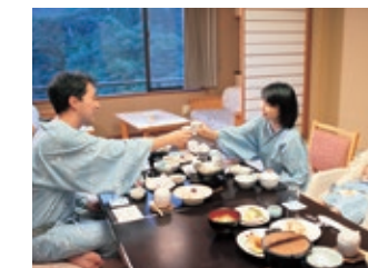
お部屋食イメージ(4名様迄受付) Image of dining in a guest room (available for up to 4 people)