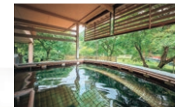
山の湯 立湯露天風呂「満天の湯・星」 Yama no Yu - outdoor standing bath "Manten no Yu - Hoshi"