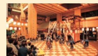
B1F お祭り広場 Basement Floor Festival Square