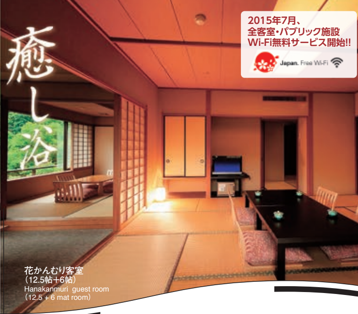
花かんむり客室 (12.5帖+6帖) Hanakanmuri guest room (12.5 + 6 mat room)