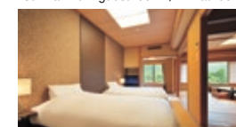
花かんむり客室(12.5帖+7.5帖:禁煙) 7.5帖(シモズベッドツイン) Hanakanmuri guest room (12.5 + 7.5 mat room, non-smoking)