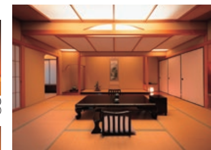
花かんむり特別室(露天風呂付)※1部屋限定となります Hanakanmuri special room (with private outdoor bath) ※Limited to one room.