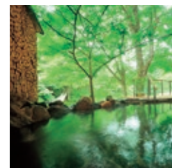
川の湯 岩露天風呂 Kawa no Yu - outdoor rock bath