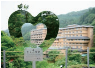
恋人の聖地モニュメント

結びの宿 愛隣館では旅行・宿泊という形で、多くのカップル・ご夫婦の仲を深める水入らずの場の提供をさせていただき、大切な方との「思い出創りの場」を提供し続けて参ります。