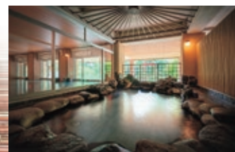
山の湯 岩露天風呂 Yama no Yu - outdoor rock bath