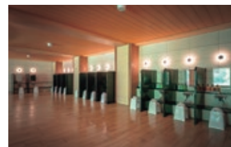
山の湯 カラン(間仕切) Yama no Yu - washing area (partition)