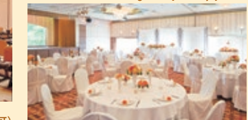
2F コンベンションホール「天神」(500㎡) 2nd Floor "Tenjin" Convention Hall (500㎡)