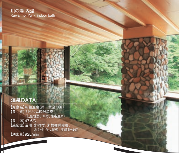
川の湯 内湯 Kawa no Yu - indoor bath

【源泉名】新鉛温泉(新黄金の湯) 飲用可 【泉質】ナトリウム・カルシウム硫酸塩泉 (低張性中性高温泉) 【泉温】70.2℃ 【適応症】浴用:動脈硬化症、きりぎりす、やけど、慢性皮膚病 飲用:胆道系機能障害、高コレステロール血症、便秘 【湧出量】360L/min