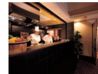
2F 石窯ダイニング「天神」※2015年4月リニューアル 2F Ishigama Dining 「Tenjin」 ※Renovated and reopened in April 2015